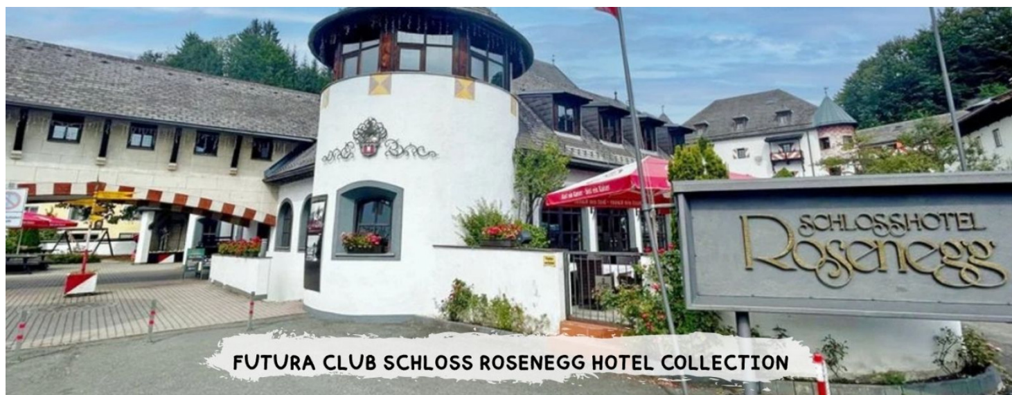
FUTURA CLUB SCHLOSS ROSENEGG HOTEL COLLECTION