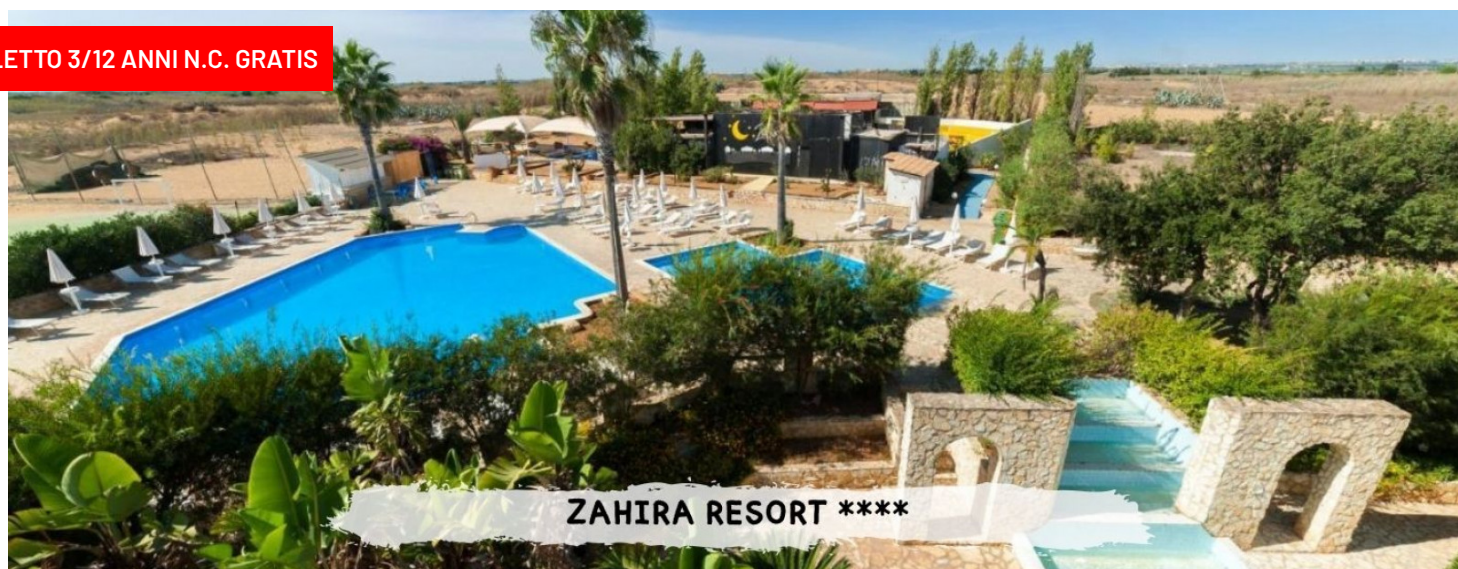
ZAHIRA RESORT ****