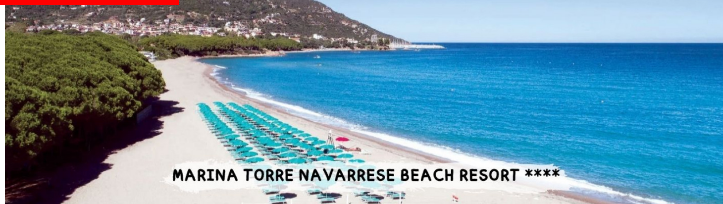
MARINA TORRE NAVARRESE BEACH RESORT ****

PER LE TUE SETTIMANE SPECIALI CLICCA QUI