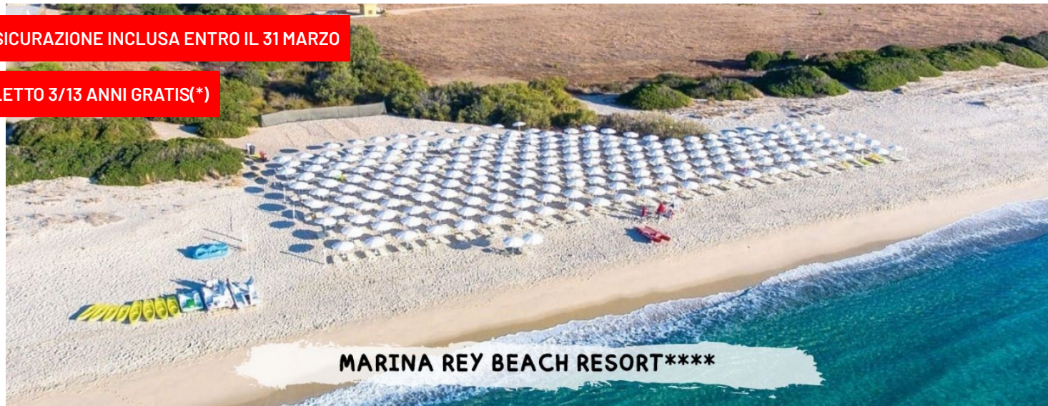
MARINA REY BEACH RESORT****