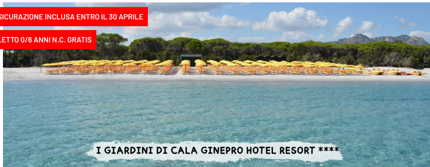
I GIARDINI DI CALA GINEPRO HOTEL RESORT ****