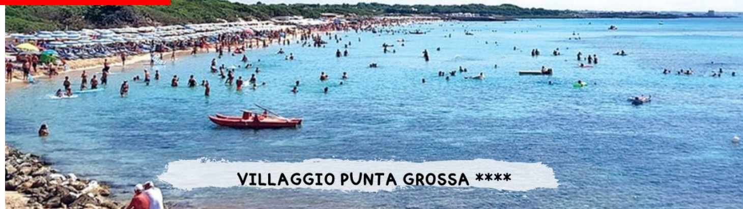
VILLAGGIO PUNTA GROSSA ****