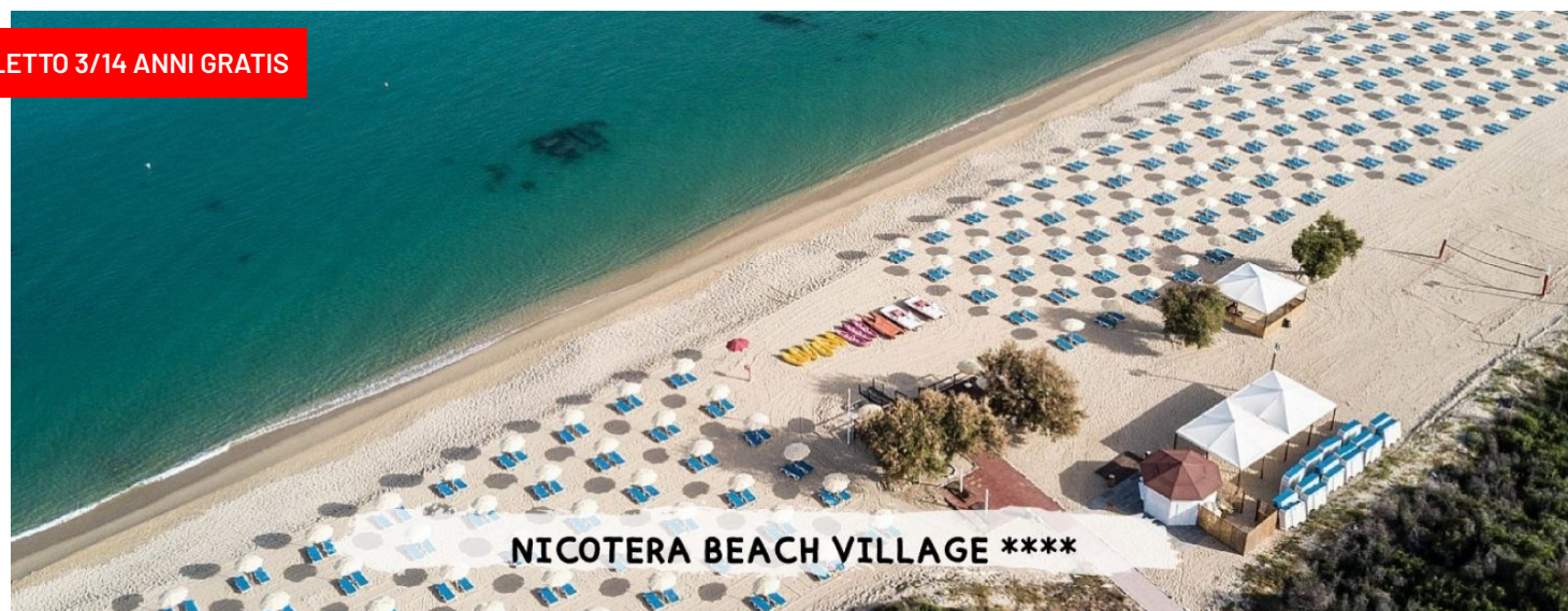
NICOTERA BEACH VILLAGE ****