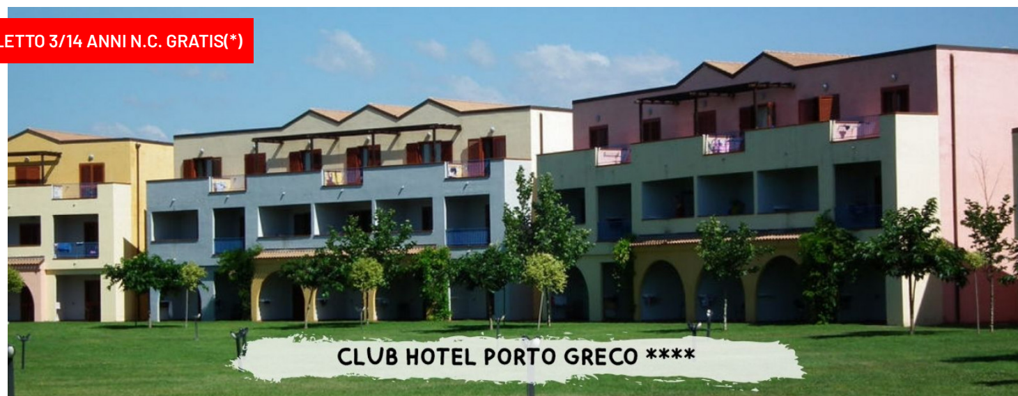
CLUB HOTEL PORTO GRECO ****