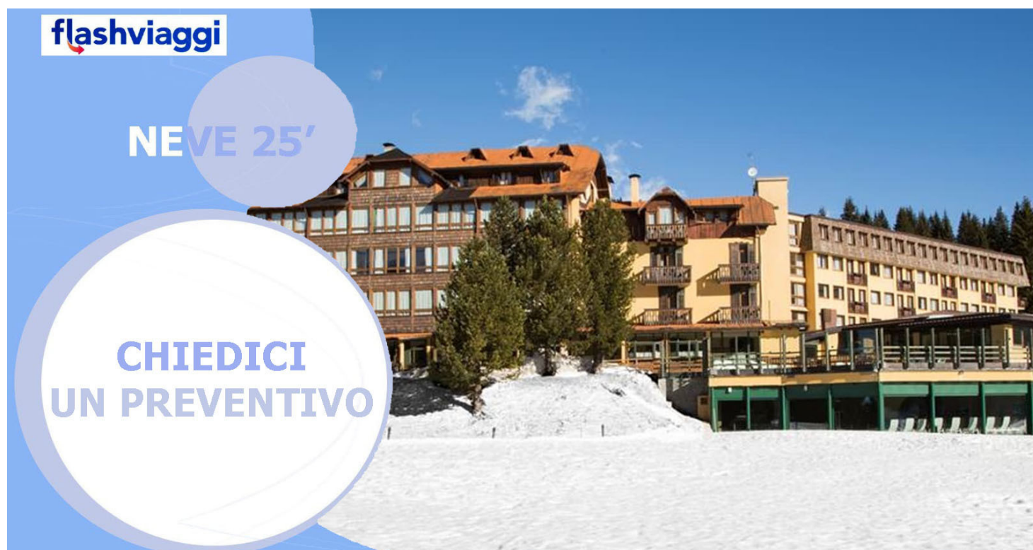
TH Campiglio Golf Hotel - mezza pensione, bevande ai pasti escluse