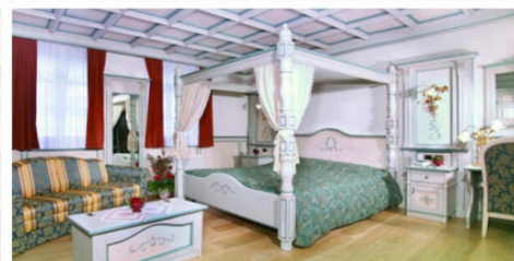
Quote a persona a settimana in camera classic in mezza pensione