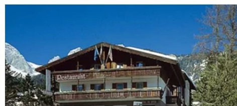
Quote a persona in mezza pensione (escluse bevande)