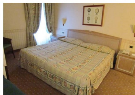
Quote scontate per persona sistemazione camera standard nel trattamento prescelto