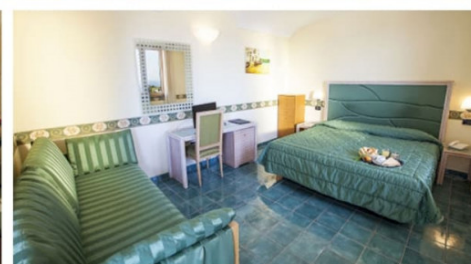
Quote per persona e per periodo sistemazione in camera Standard