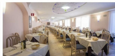
Quote Scontate Flash per persona sistemazione in camera Standard